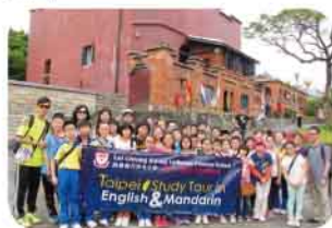
台北英普交流之旅大合照