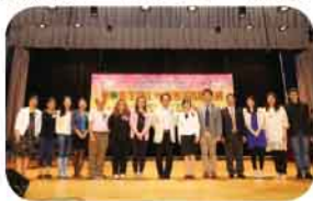
決賽暨頒獎禮嘉賓合照