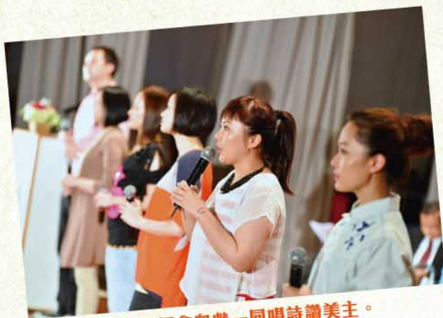
ETERNITY帶領會眾獻一同唱詩讚美主。