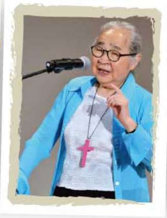
喜樂婆婆 (小金子)：「有主耶穌的愛，一個家才得真正的快樂！」