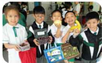
同學們齊心參與「開心果日」活動