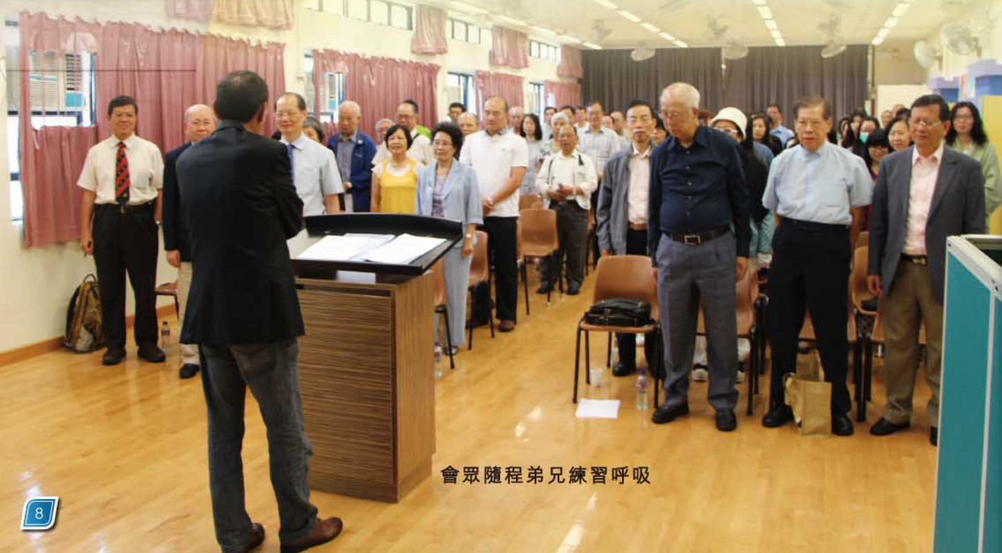
會眾隨程弟兄練習呼吸