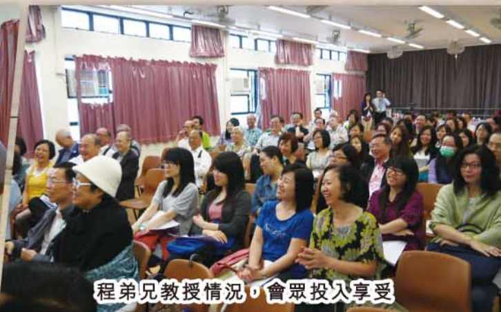
程弟兄教授情況，會眾投入享受

程弟兄在電視電台任職多年，曾指導無數專業藝人和主持人。正確呼吸和嗓門保護、聲音語調掌握、高低抑揚運用和說話生動傳神等竅門，對藝人主持人尤為重要，而這正是程弟兄的訓練專長。程弟兄精心揉合多年課業，在這講座中扼要清晰傳授心得精華，參加者雖覺意猶未盡，但仍大有所獲。在程弟兄指導下，參加者即席實習所學，一同練習呼吸的技巧、又分成小組互道故事、全場同聲集誦歌唱。