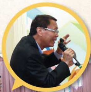
答問環節 眾踴躍發問