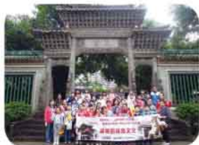
聖馬太學校學生前往廣東佛山交流學習