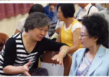
小組實習說話技巧

程弟兄演說精彩，別無冷場，令人如沐春風，因而兩個多小時演講仿如瞬間。甫開始，程弟兄即道出心態之重要：心境年青人則年青，心境老時人才算老，只要心態正確，聲音就會美麗。他亦勉勵會眾專注當下，用心投入每一生活環節，以心以誠處事待人，這樣的聲音自會真摯感人。程弟兄除了教授呼吸技巧、聲音運用和語言表達，更傳達了人生哲理和處世態度，實為「養聲、養生」之真意。