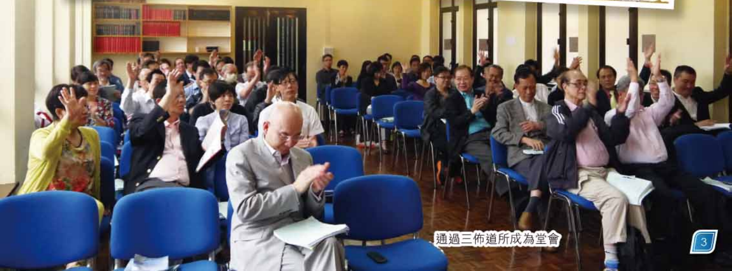
通過三佈道所成為堂會