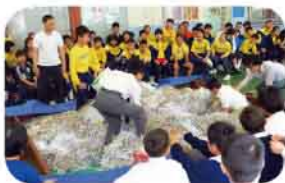
同學們正進行尋找復活蛋比賽