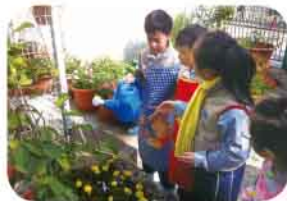
同學練習如何照顧這次綠化校園花卉