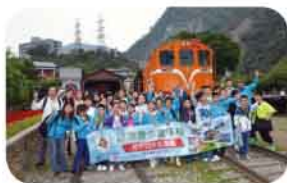
建於1919年的「車埕車站」