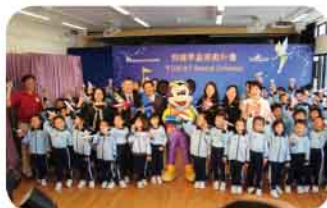
「飛躍學童」獎勵計劃啟動禮